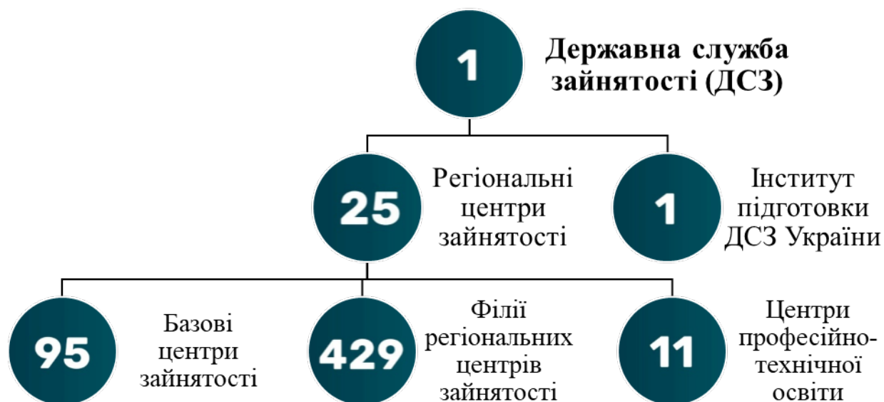
Рисунок 1 – Організаційна система Державної служби зайнятості України.

Своєю чергою Державний центр зайнятості, який є головним урядовим органом у централізованій системі ДСЗ, складається з 11 управлінь, до кожного з яких входять від двох до чотирьох відділів або секторів, окремого сектору з питань запобігання та виявлення корупції, а також відділів комунікацій та внутрішнього аудиту. Регіональні центри зайнятості зазвичай мають дещо меншу кількість відділів, проте все ще віддзеркалюють структуру Державного центру зайнятості.